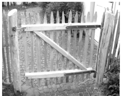
Tor 100 x 100 cm 4 cm Zwischenraum rechts aufgehängt