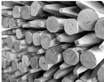
Kastanienpfähle Ø 8-10 cm