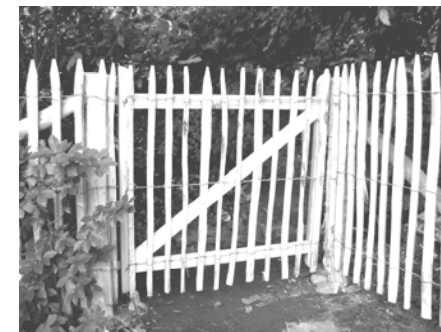
Torrahmen aus Lärchenkantholz mit befestigtem Zaunstück, Höhe 100 cm - 4 cm Zwischenraum

Die Stämme werden geschält gespalten, angespitzt und mit verzinktem Draht zu 5 oder 10 Meter langen Rollen verbunden.