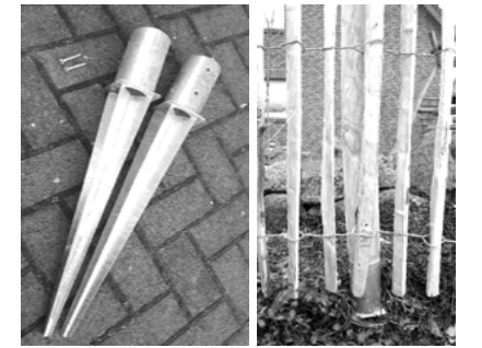
Einschlagbodenhülse rund, Ø 8 cm 2mm /3mm Blechstärke, 2 Schrauben