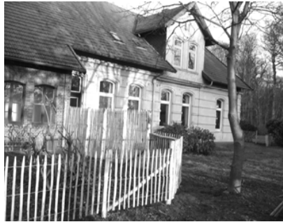
Höhe 100 cm - 8 cm Zwischenraum

Dieser robuste und langlebige Zaun ist vielfältig verwendbar und einfach zu montieren. Die Kastanienwälder Frankreichs liefern das Rohmaterial für Zäune und Pfähle. Die nachhaltige Waldwirtschaft beruht auf folgendem Prinzip: Ähnlich wie bei Weiden treiben aus dem Stock neue Schösslinge aus. Diese schlanken Ruten wachsen zu 6 – 12 cm starken Stämmen heran und werden dann geerntet. Der Kreislauf beginnt wieder von Neuem. Schon die Winzer schätzen diese graden und zähen Stangen und Pfähle zum anbinden der Weinreben, da das Holz von Natur aus eine sehr gute Haltbarkeit hat. Zaun und Pfähle werden in einem Betrieb in Frankreich hergestellt.